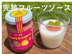
完熟フルーツソース