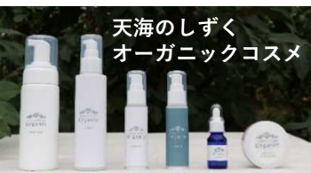
天海のしずく オーガニックコスメ