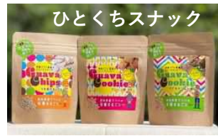
ひとくちスナック