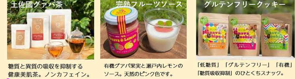
糖質と異質の吸収を抑制する健康美肌茶。ノンカフェイン。有機グアバ果実と瀬戸内レモンのソース。天然のピンク色です。「低糖質」「グルテンフリー」「有機」「糖質吸収抑制」のひとくちスナック。