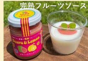
有機グアバ果実と瀬戸内レモンのソース。天然のピンク色です。