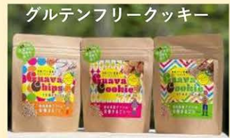
「低糖質」「グルテンフリー」「有機」「糖質吸収抑制」のひとくちスナック。