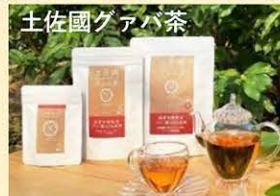
糖質と異質の吸収を抑制する健康美肌茶。ノンカフェイン。