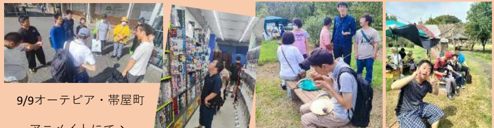
9/9 オーテピア・帯屋町